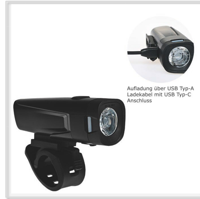
Aufladung über USB Typ-A Ladekabel mit USB Typ-C Anschluss